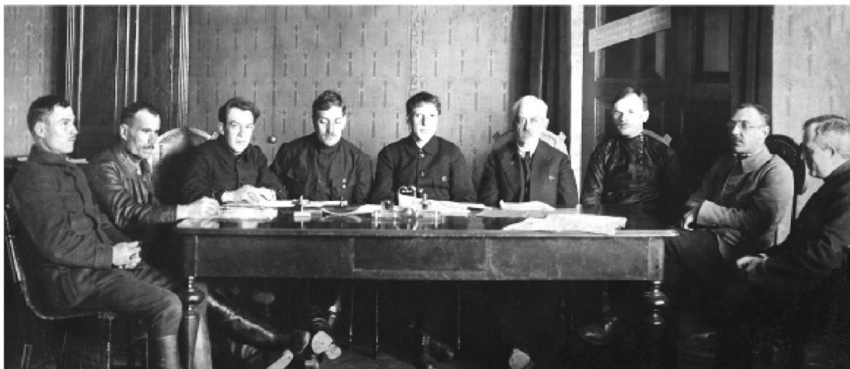
Рис. 1. Правление "Сибугля" в Томске, 1920 г.

На следующий день 19 февраля 1920 г. постановлением № 621 та же Комиссия, расположенная в Омске, объявила собственностью государства все угольные предприятия Западной Сибири со всем имуществом и капиталами, где бы они не находи-