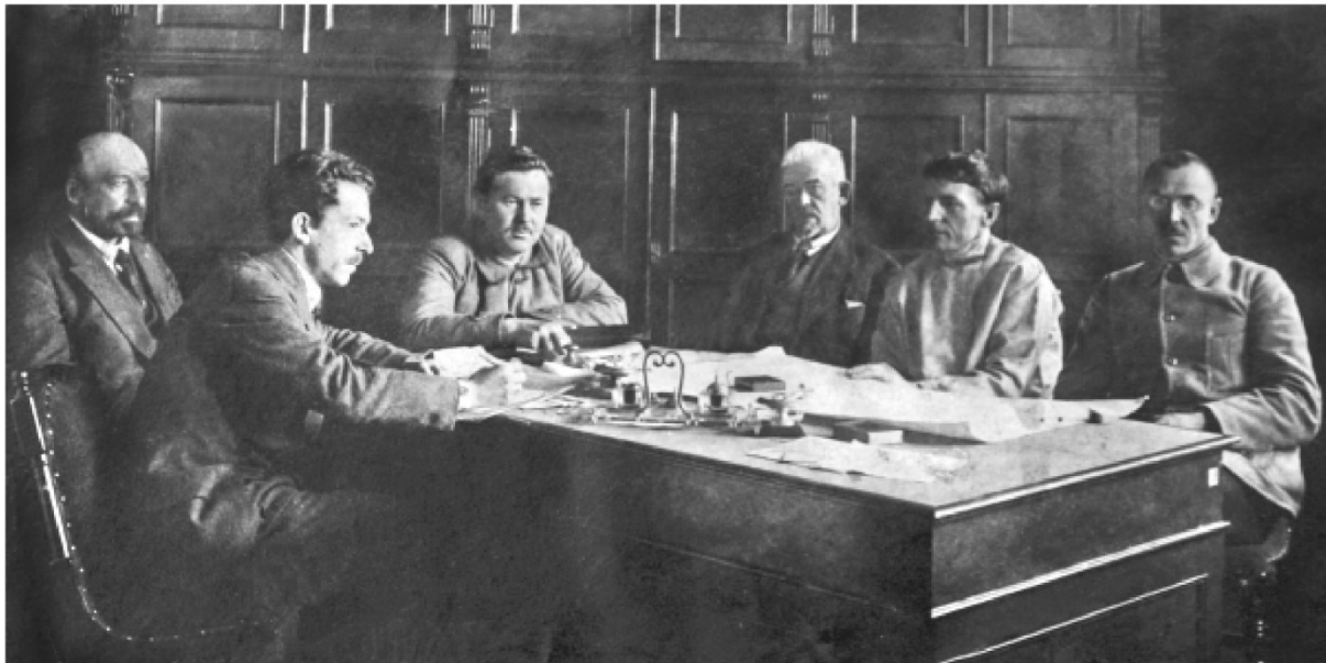
Рис. 2. Члены правления "Сибугля" в Ново-Николаевске, 1920 г.

Рудники Кузбасса были поделены на группы, соответствующие 5 районам: Анжеро-Судженский, Северный Кузнецкий, Центральный Кузнецкий, Южный Кузнецкий, Минусинский.