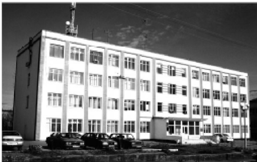
Рис. 17. Здание ассоциации "Киселевскуголь", фото 2005 г.

Следующим шагом в развитии органов управления угольной промышленностью в Кузбассе был переход к объединениям типа "ассоциация" и "корпорация". В середине 1992 г. на территории Кузнецкого бассейна действовали ассоциации "Киселевскуголь" (рис. 17), "Прокопьевскуголь", "Ленинскуголь", концерны "Кузбасскарбурголь" (с местонахождением управления в г. Кемерово), "Северокузбассуголь" (г. Кемерово), "Кузнецкуголь" (г. Новокузнецк), "Кузбассшахтострой" (г. Кемерово) и другие.