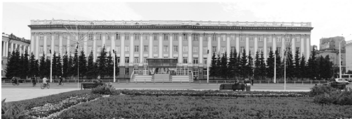
Рис. 14. Здание комбината "Кузбассуголь" на площади Советов в г. Кемерово, фото 2007 г.

бассуголь", "Южкузбассуголь", производственное объединение по добыче угля гидравлическим способом "Гидроуголь", производственное объединение по обогащению угля "Кузбассуголеобогащение", Всесоюзный научно-исследовательский и проектно-конструкторский угольный институт "Куз-НИУИ", Кузнецкий научно-исследовательский и проектно-конструкторский институт углеобогащения "КузНИУглеобогащение", проектные конторы в городах Кемерово, Прокопьевск, трест совхозов, реорганизованный в п. о. сельского хозяйства и т. д.