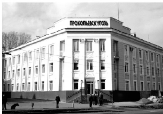
Рис. 12. Здание комбината "Прокопьевскуголь", фото 2005 г.

Новая генеральная схема управления угольной отраслью, разработанная для конкретизации постановления ЦК КПСС и Совета Министров СССР "О некоторых мероприятиях по дальнейшему совершенствованию управления промышленностью", принятого в марте 1973 г., предусматривала создание производственных объединений на базе угольных комбинатов и трестов, а также переход на двухзвенную систему управления в РСФСР: Министерство угольной промышленности СССР – производственное объединение.