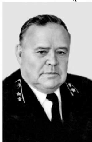
Рис. 13. В. П. Романов

В 1961-1978 гг. начальником комбината "Кузбассуголь" был Герой Социалистического Труда Владимир Павлович Романов (рис. 13).