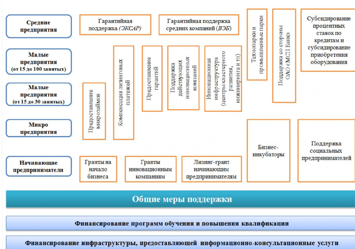
Рис. 2. Основные меры финансовой поддержки субъектов МСП