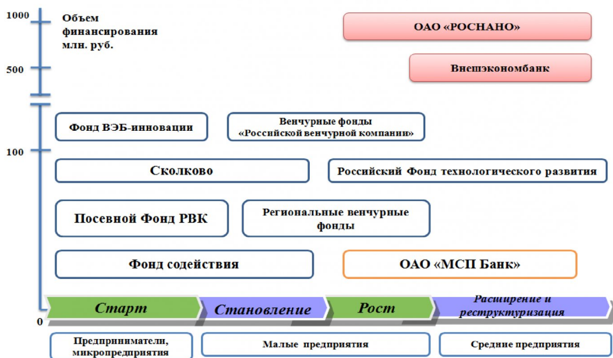
Рис. 3. Система финансовых институтов развития МСП в рамках «инновационного лифта» в зависимости от категории субъектов МСП

– Программа поддержки субъектов малого и среднего предпринимательства в агропромышленном комплексе, реализуемая Минсельхозом Рос-