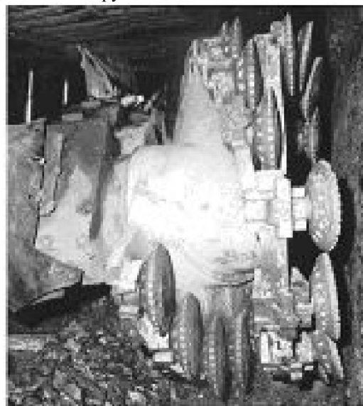
Рис. 1. Общий вид опытного образца рабочего органа механизированного комплекса, оснащенного дисковым скалывающим инструментом.

На рис. 1 представлен опытный образец рабочего органа механизированного комплекса, оборудованного, в качестве породоразрушающего, дисковым инструментом.